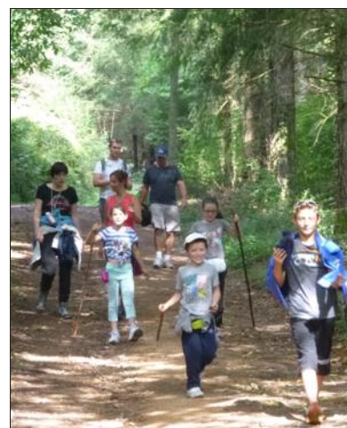
■ Campagne, bois, viaduc de Mussy, on profite des paysages autour de Chauffailles.