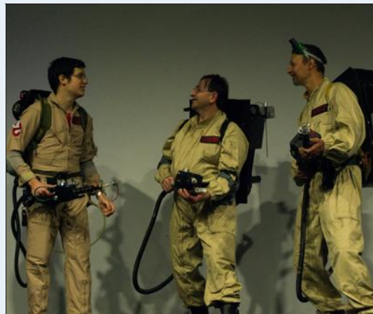
■ "Who you gonna call ?". Le cosplay aura sa place au salon A Little Country Of.

MATOUR. Gymnase. Samedi 17 septembre, de 14 h à 19 h. Dimanche 18 septembre, de 10 h à 18 h. Tarif : 1 €/jour. Infos sur page Facebook.